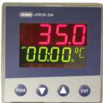
Jumo Mikroprozessorregler dTRON 304