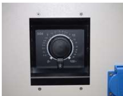
SAL-Membranpumpe GF DDA