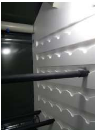
Einfräsungen zur Aufnahme der Probenstangen