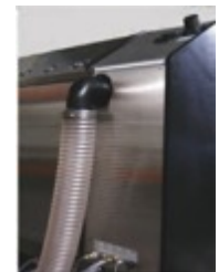
Anschluss an den Prüfschrank