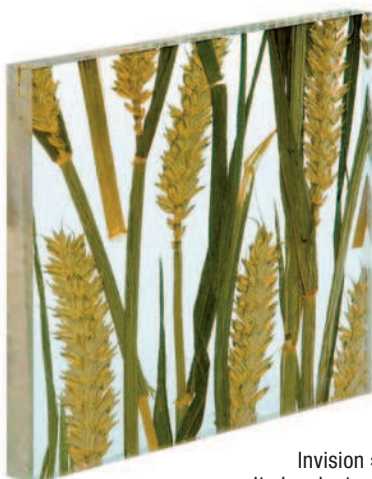
Invision »Corn« mit eingelegten Ähren

beitet. Acrysign hat bereits zur ZOW im Februar 2009 Hocker mit Sitzflächen aus dem aktuell bis 1000 x 1000 mm großen Werkstoff gezeigt. Zenshine lässt sich Fräsen, Bohren, Sägen, Scheren und Stanzen, Laserschneiden, Kalt- oder Warmbiegen, Tiefziehen etc. Hierbei müssen die technischen Gegebenheiten der Leuchtmittel berücksichtigt werden. Auch Membranverformung ist möglich. So ist Zenshine für das Industriedesign und für besondere Anwendungen im Innenausbau hochinteressant. JN