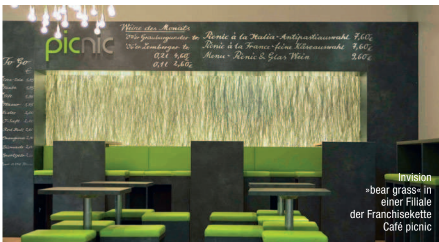
Invision »bear grass« in einer Filiale der Franchisekette Café picnic

Designpanel Invision ist transluzent und für Hinterleuchtung verschiedener Art bis 70°C geeignet. Besonders elegant ist die Kombination mit der Produktreihe »Lightpanel«. Die LED-Lichteinspeisung über die Kanten sorgt für eine homogene Lichtverteilung bei einer Bautiefe von nur 28 mm. Das Sandwich besteht aus der Front in satiniertem Acrylglas, einer