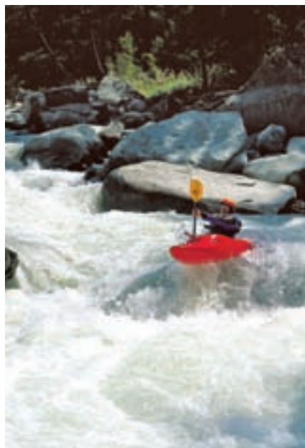
Katarakt auf der Grand Eyvia

Nach diesem Warm-Up lohnt es sich, etwas Zeit an der berühmten Slalomstrecke in Bourg. St. Maurice zu verbringen. Wenn man nicht durch die Tore zirkelt, ist die Strecke zwar technisch nicht allzu diffizil,