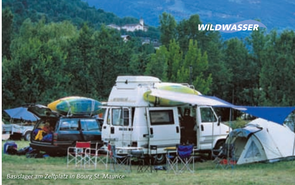
Basislager am Zeltplatz in Bourg St. Maurice