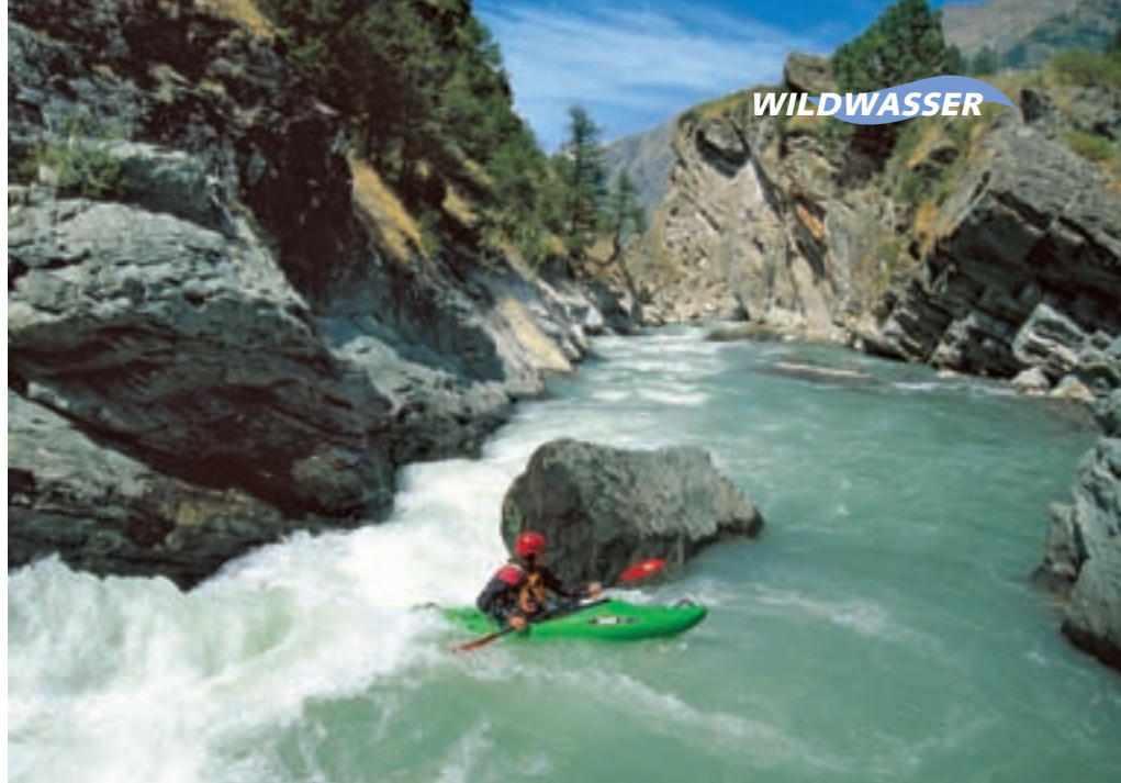
In der ersten Schlucht der Grand Eyvia.

Auch an der Grand Eyvia bilden mensche- liche Eingriffe leider ein gewisses Gefah- renpotential. Ungeachtet dessen ist der Fluss bei guten Bedingungen sicherlich die Krönung dieses Flussquartetts. Wie bei al- len Seitentälern des Aostatals geht es auch auf dem Weg zur Grand Eyvia erst einmal steil bergauf. Anfangs versteckt sich der abgeleitete Fluss tief unten in einer engen Schlucht, weiter oben stürzt er sehr ein- drucksvoll direkt neben der Strasse talwärts und dürfte für Extrempaddler noch einige neue Herausforderungen bieten. Interessant für Normalsterbliche wird es oberhalb einer Wehranlage, die den Aus- stieg markiert. Spätestens an der nächsten