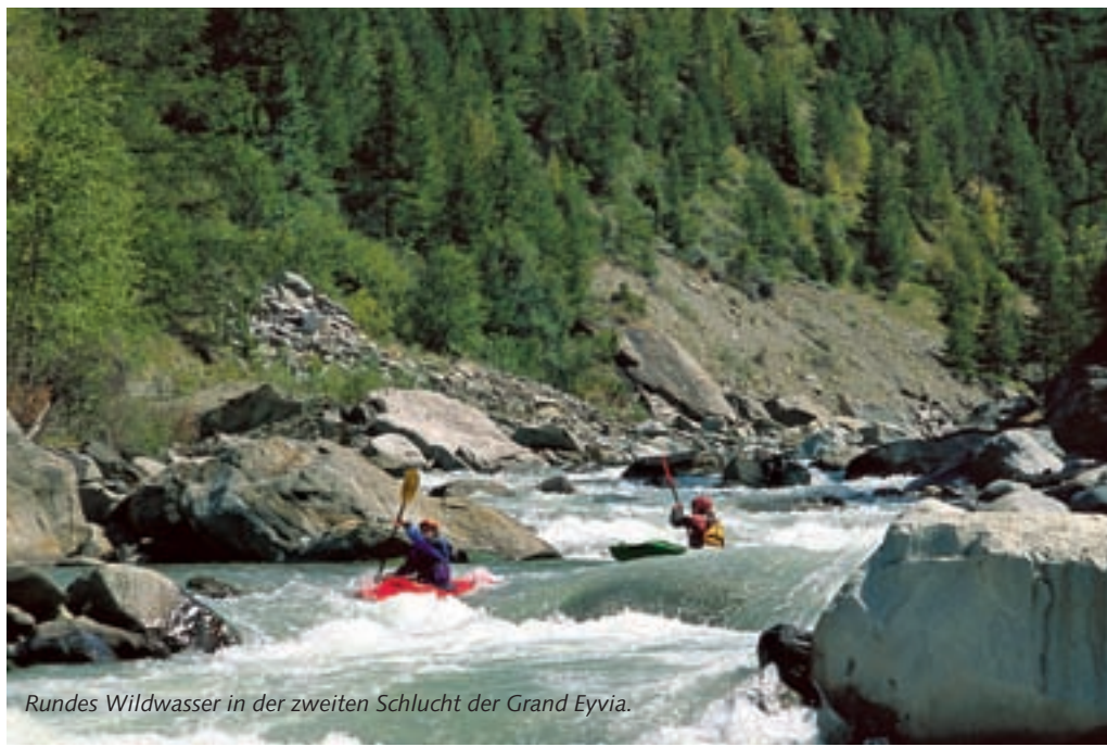
Rundes Wildwasser in der zweiten Schlucht der Grand Eyvia.

ihn erreichen. Definitiv kein Revier für Anfänger also, dafür aber ein perfektes Ziel für Fortgeschrittene mit Ambitionen.