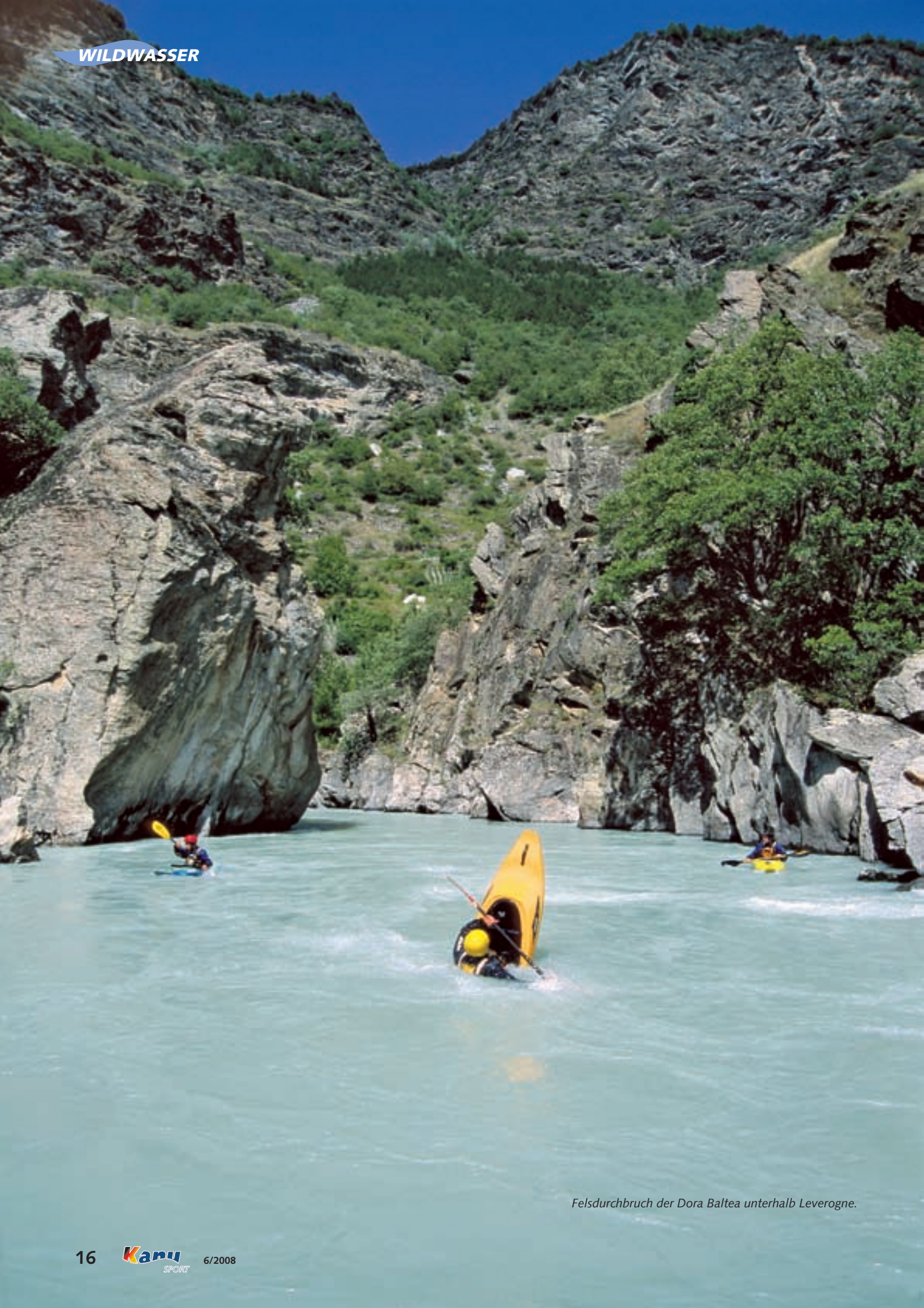
Felsdurchbruch der Dora Baltea unterhalb Leiverogne.