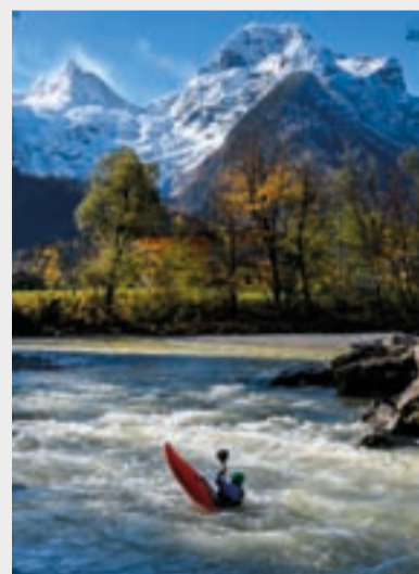
September Matthias Breuel