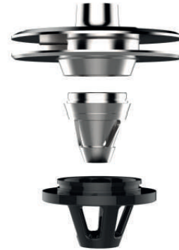
Kegelschneidradsystem Cone-cutting system