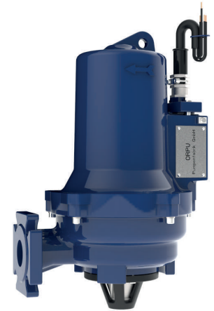
ORCUT TES 148