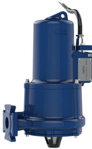
ORCUT TES 174